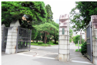
非正規職員の「雇止め」問題が起きている東北大学＝仙台市

東北大学で定期契約で働く約3千人の非正規職員が今後順次、契約を更新されない「雇止め」になりかねない事態になっている。改正労働契約法で、契約更新の期間が5年を超えると働き手が無期契約を求めることができるようになり、大学側が契約更新の規定を見直したためだ。非正規職員の労働組合は「希望する全員を無期雇用に転換すべきだ」と主張している。