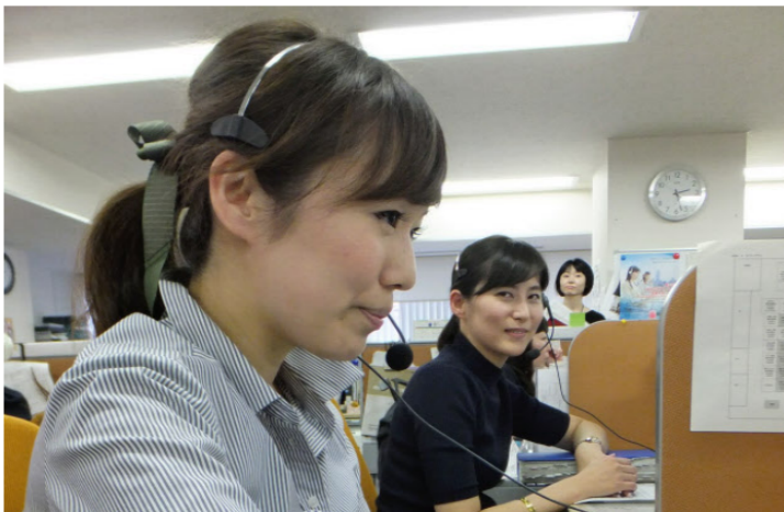
SMB C日興証券は契約オペレーターの高い技量を買い専門社員制度を設けた（東京都豊島区の池袋サービスセンターで）

非正規社員のうち、期限付きの労働契約で働くパート社員や契約社員1485万人にとって、今から2018年4月までは、将来の働き方を考える特別な時期になるだろう。18年4月には労働契約法の5年転換ルール（無期転換ルール）により、無期転換権を手にする人が大量に出るからだ。働き方改革に敏感な企業は前倒しで「単純無期化」や「限定正社員化」などの転換ルートを設け始めた。